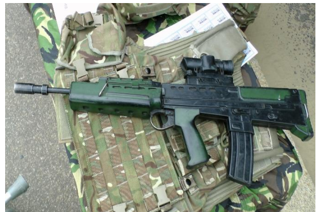
(Alex Borland (publicdomainpictures.net))