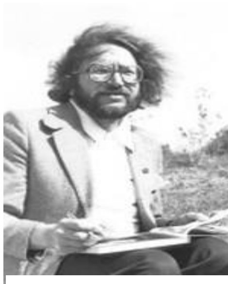
(S. Geda, „7 meno dienos“ Nr.925 (3))

Tad leisk man džiaugtis Kiekvieną dieną. Neleisk liūdėti, Nes skauda sielą.