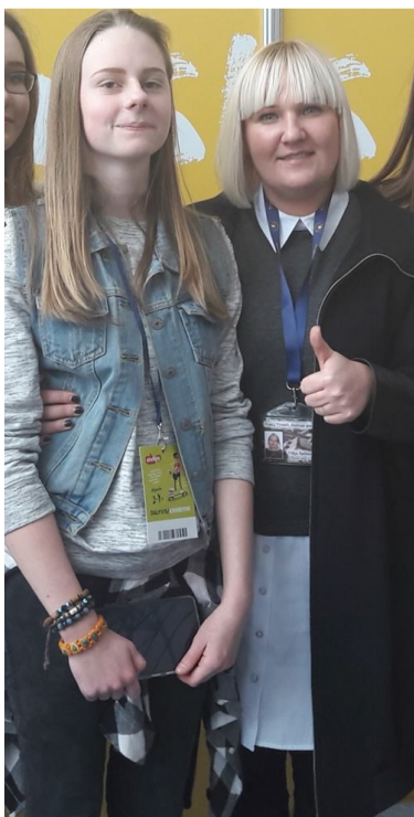
Urtė su klasės vadove

„Jeigu manai jog esi per mažas, kad ką nors pakeistumei, pabandyk užmigti su uodu kambaryje!“ - tai mano gyvenimo kredo.