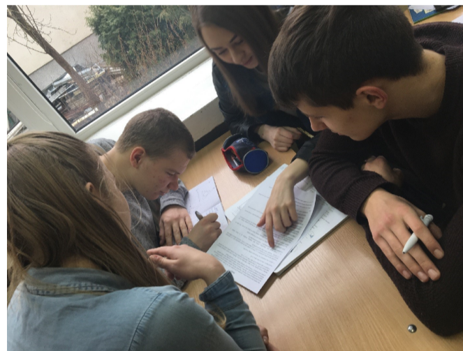
2d klasės mokiniai