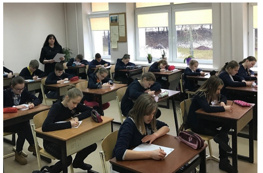
5c klasė rašo diktantą