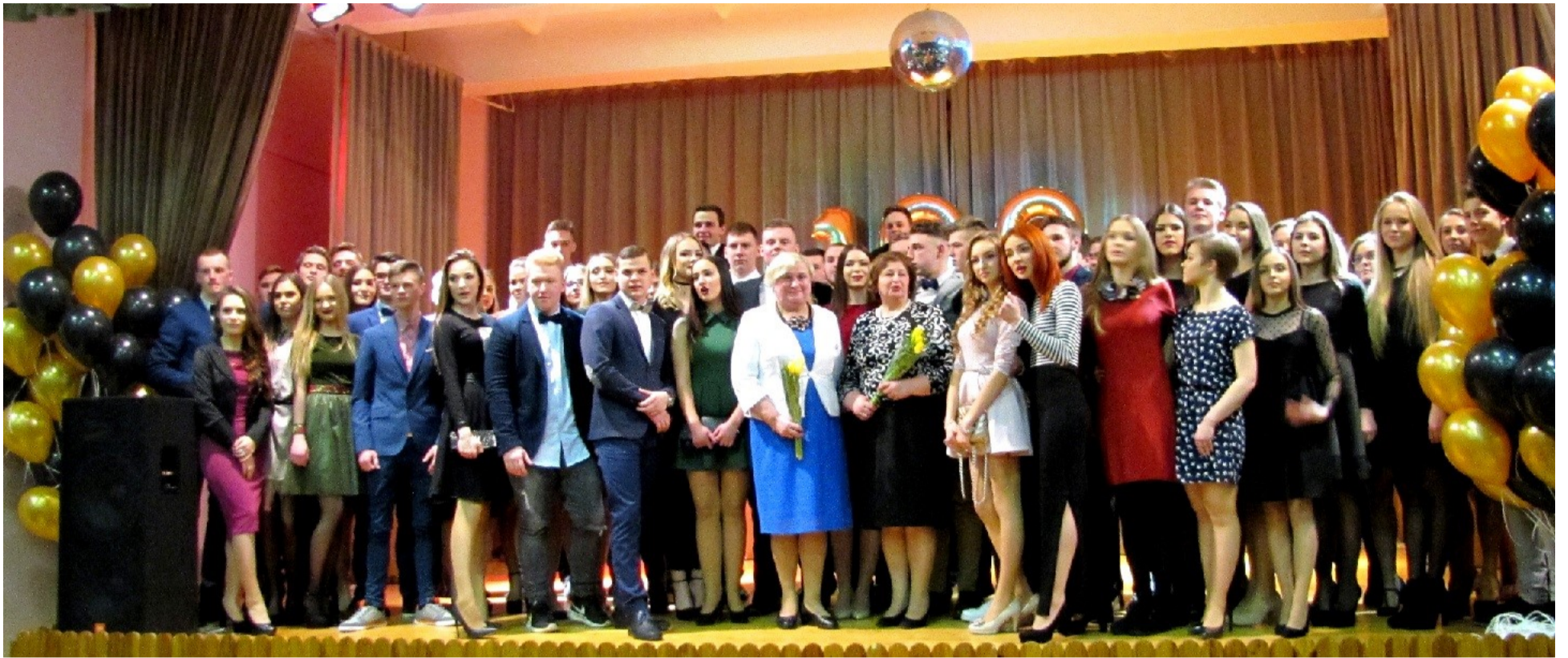
12-okai su klasės vadovėmis