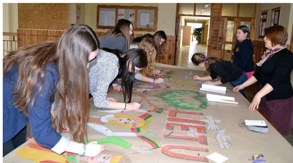
Viena iš veiklų

valstybę. Visi bėgantys buvo linksmi, veidus puošė trispalvės. Bėgime ir atrodė, tarsi mes iš tikrųjų taip kovojame už Lietuvos laisvę.