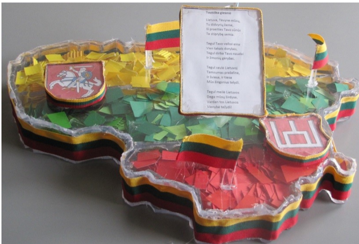
Kamilės Baltrūnaitės instaliacija „Ką man reiškia laisvė?“