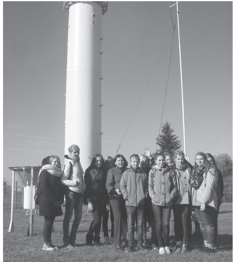
„Gaubliuko“ nariai su vadove