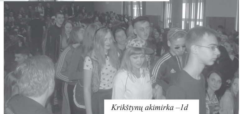
Krikštynų akimirka - 1d