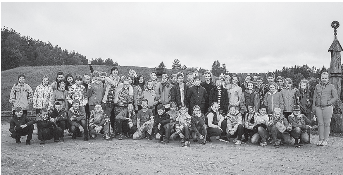
Nuotrauka Nr. 23 Ekskursantai Anykščiuose

Ankstų rugsėjo 28 d. rytą 5c, 6a ir 6b klasių mokiniai su auklėtojomis vyko į Anykščius.