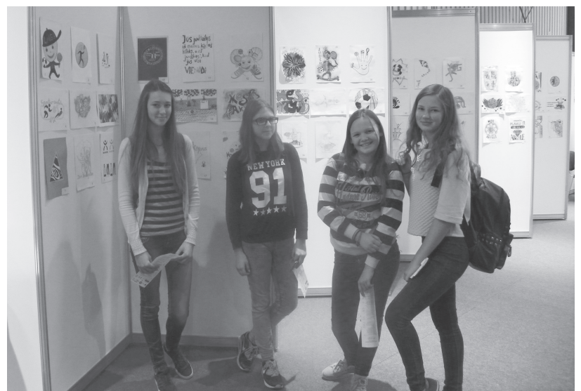
Dailininkės iš 7a