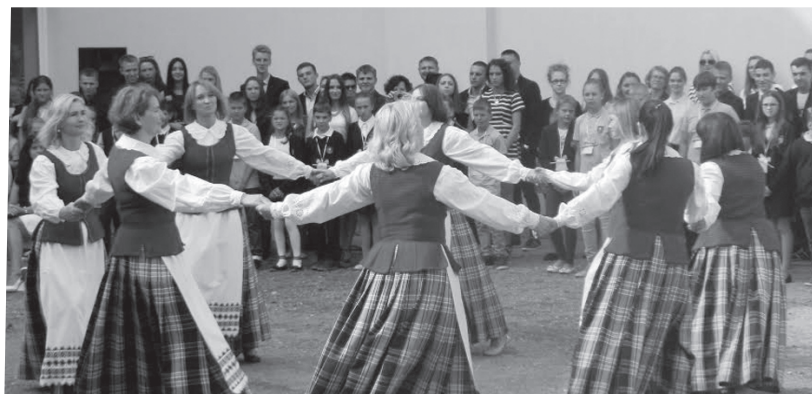
Rugsėjo I-osios šokis