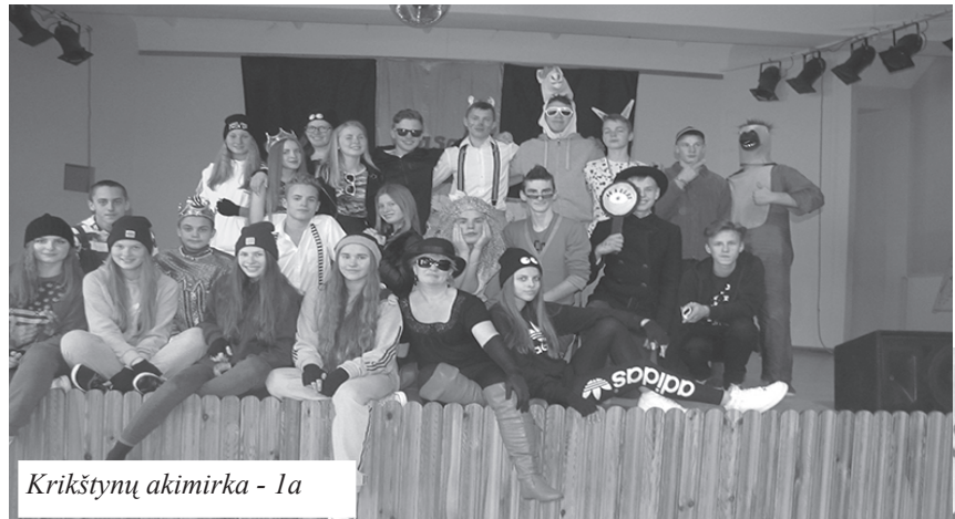
Krikštynų akimirka - 1a