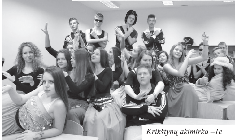
Krikštynų akimirka - 1c