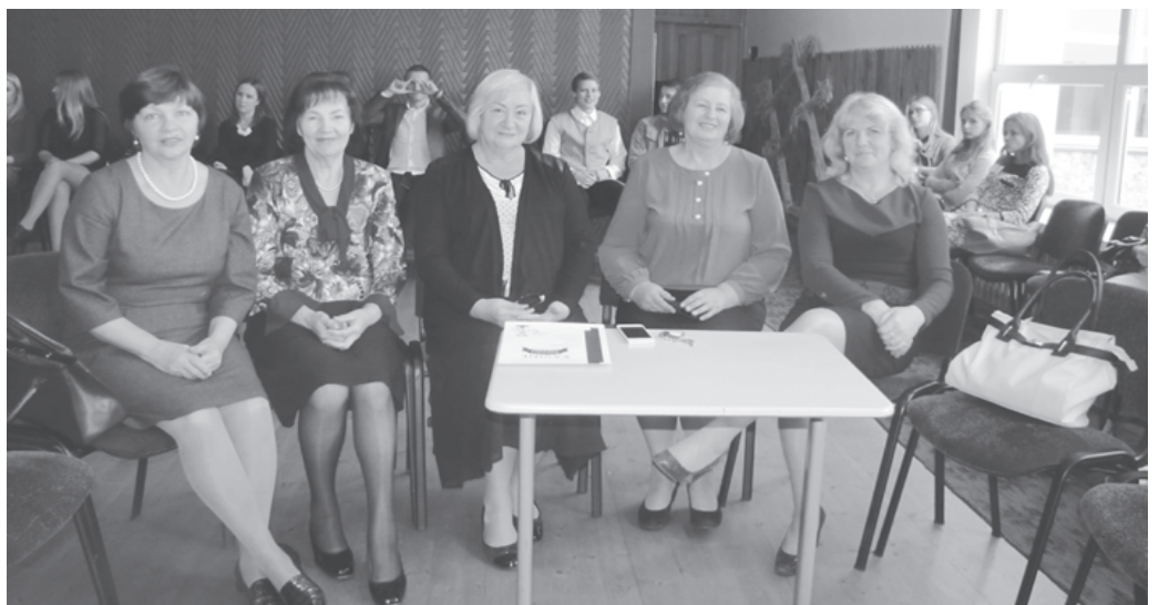
Mokytojų dienos šventėje