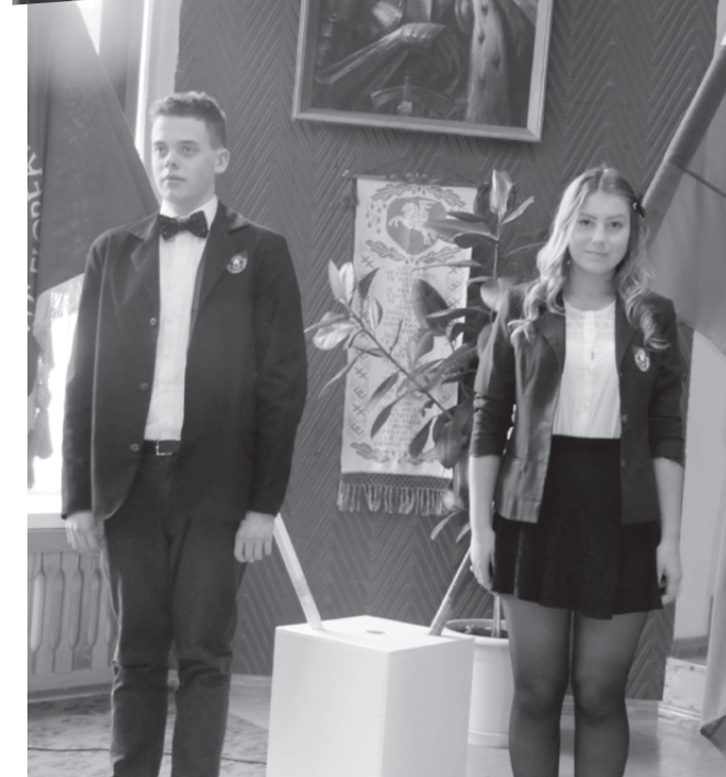
Gimnazistai prie vėliavos