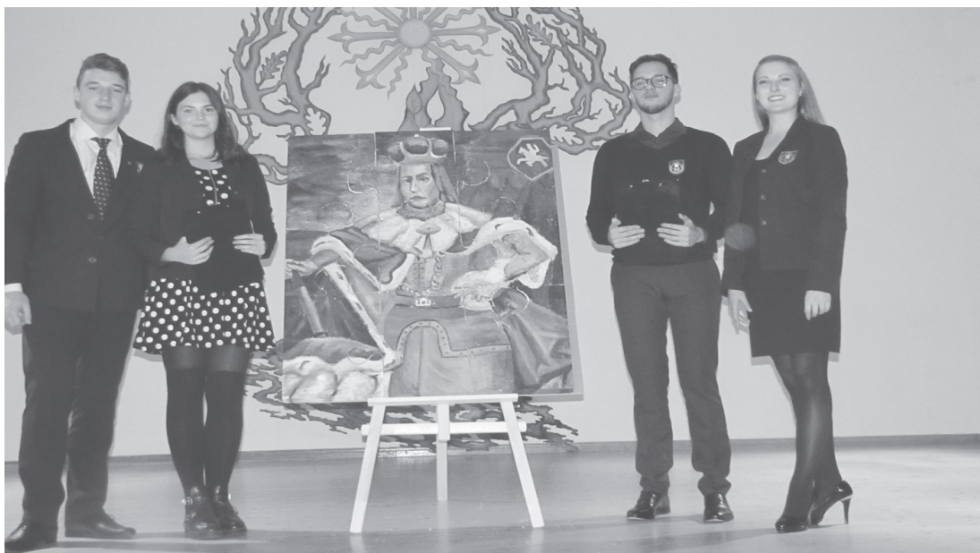
Gimnazistai prie dėlionės