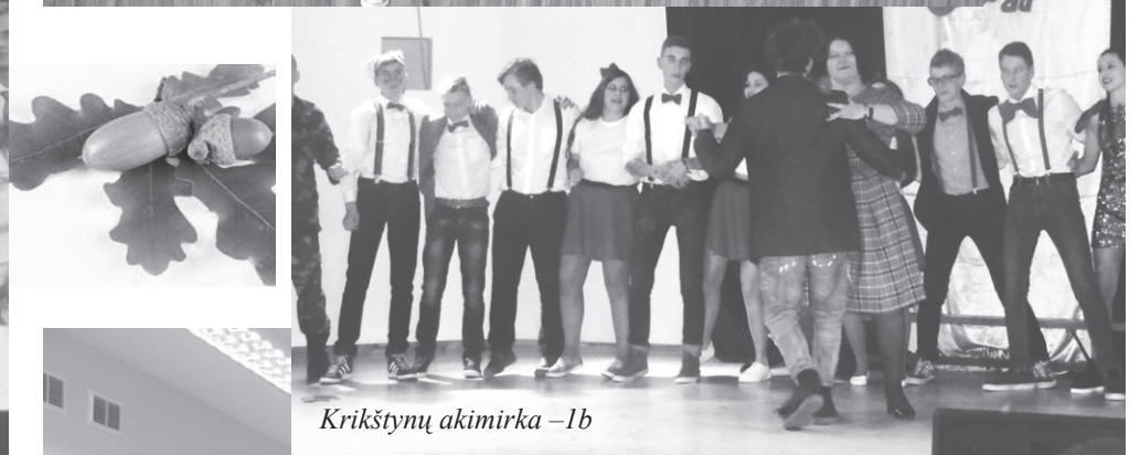
Krikštynų akimirka - 1b