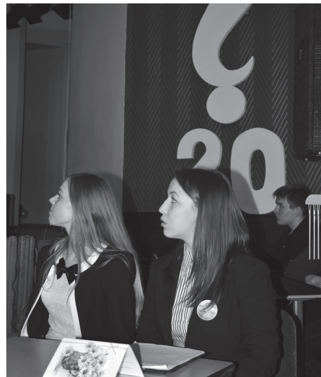
Šventinio renginio vedėjos