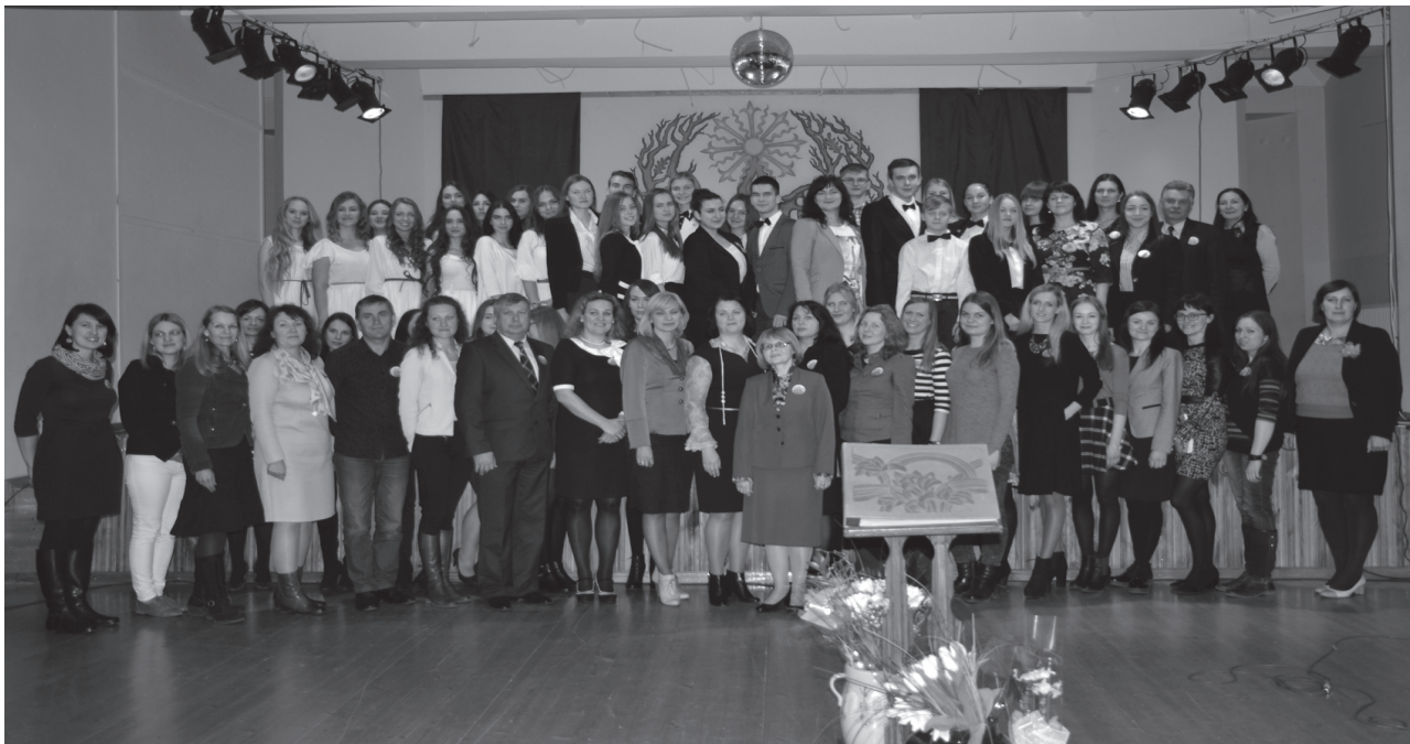
„Klaustuko“ jubiliejaus dalyviai