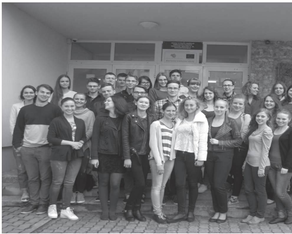
41-os laidos abiturientai

Kaip mes šventėme „Klaustuko“ 20-ties metų jubiliejų