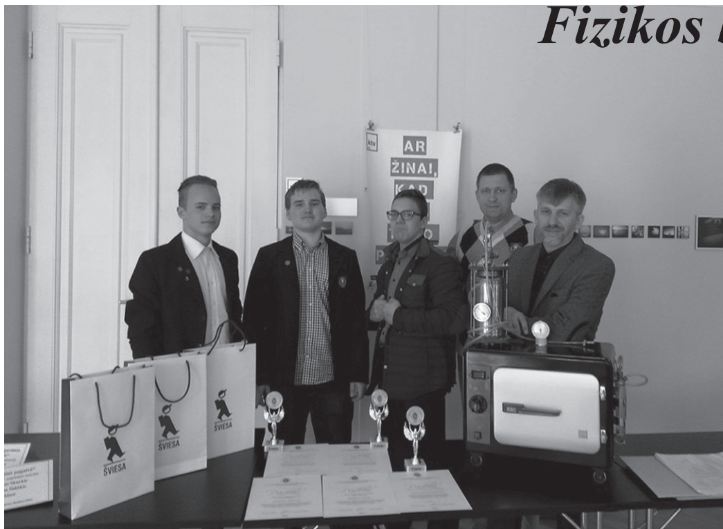
Jaunieji išradėjai ir jų mokytojai