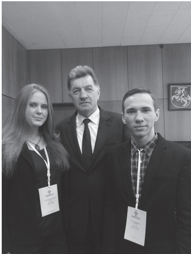
Meida ir Vilius su LR Ministru Pirmininku Algirdu Butkevičiumi