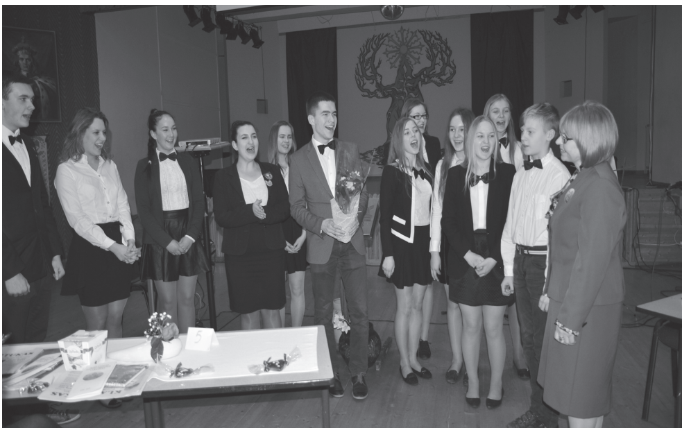
Jaunieji žurnalistai ir jų vadovė

„Klaustuko“ jubiliejus buvo geriausias renginys, šiais mokslo metais vykęs mūsų gimnazijoje.