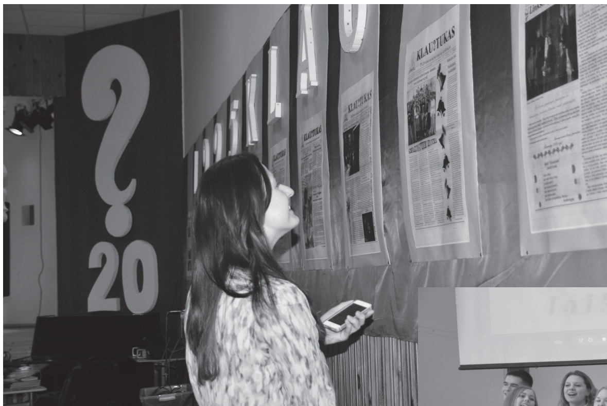
Gimnazijos aktų salė papuošta „Klaustukais“