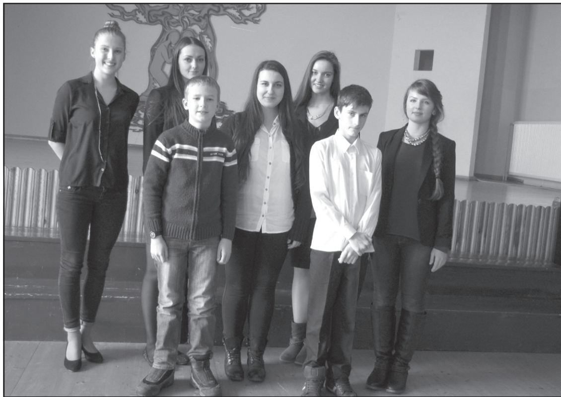
Meninio skaitymo konkurso dalyviai