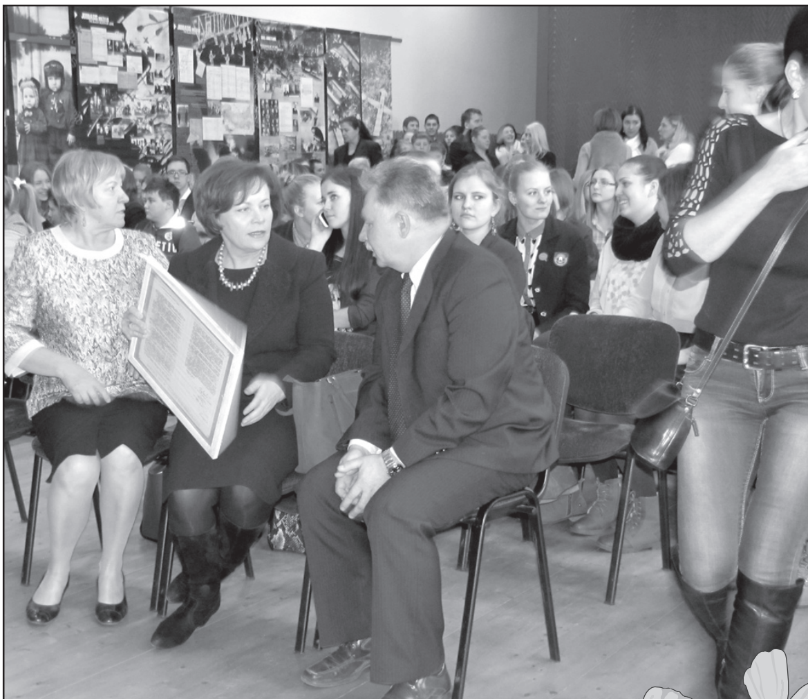
Vasario 16-osios minėjimas