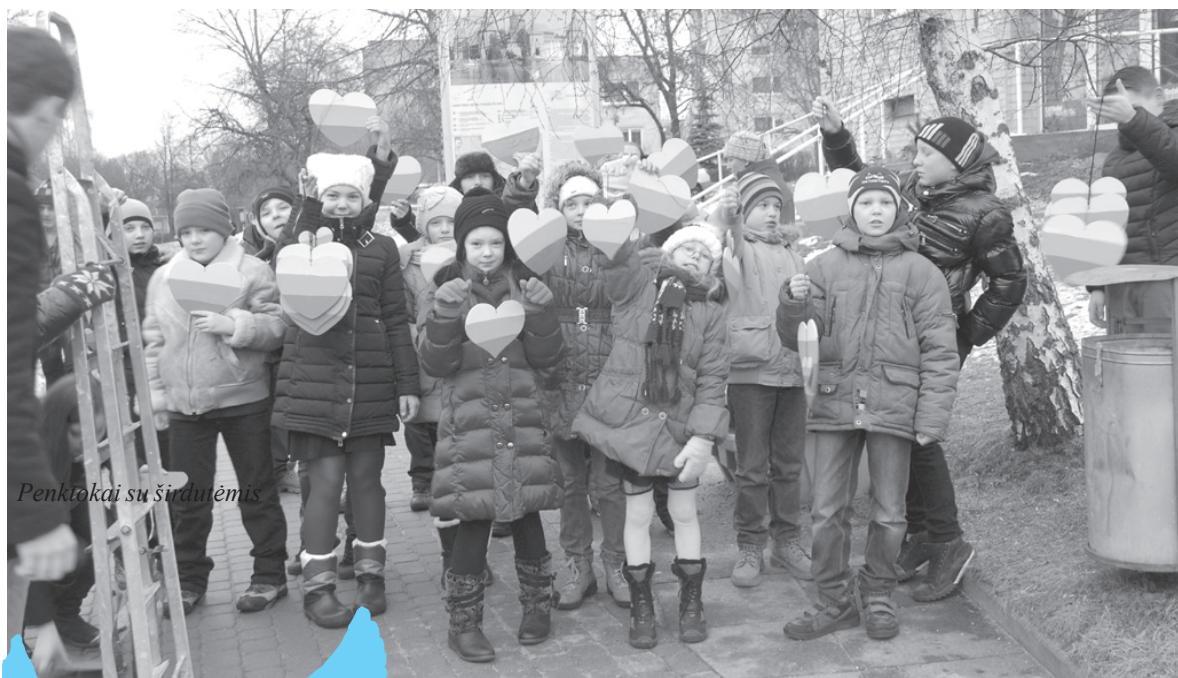
Penktokai su širdutėmis