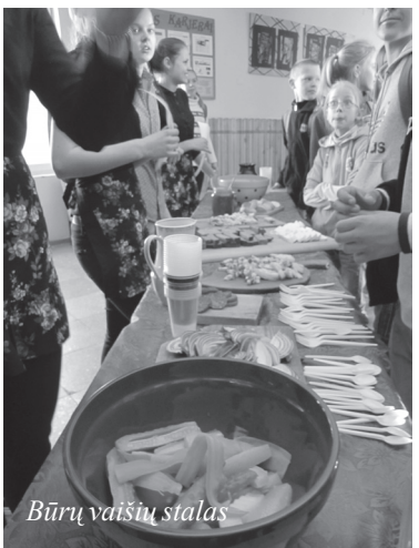
Būrų vaišių stalas