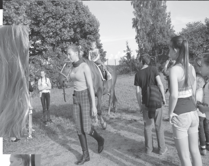
Šeimų šventės akimirkos