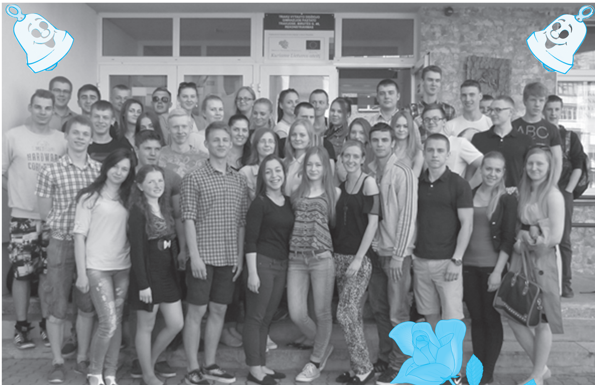
40-osios laidos abiturientai prie gimnazijos slenksčio