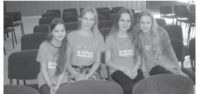
Pozuojame šventės prisiminimui.