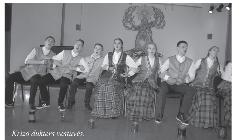
Krizo dukters vestuvės.