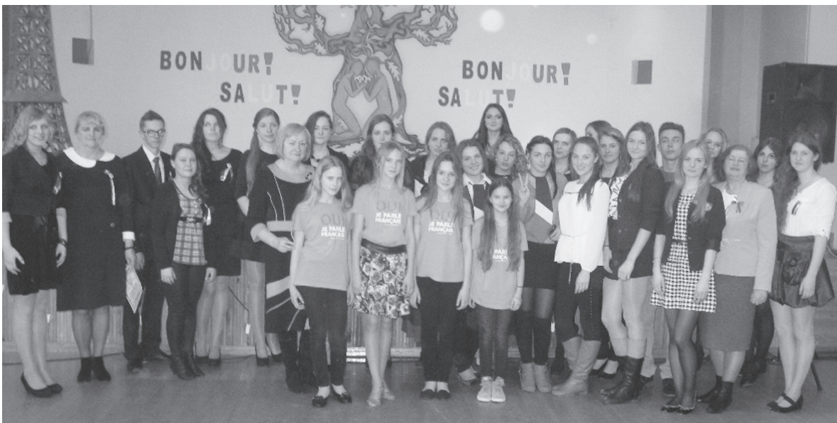
Jauniausios šventės dalyvės - šeštokės