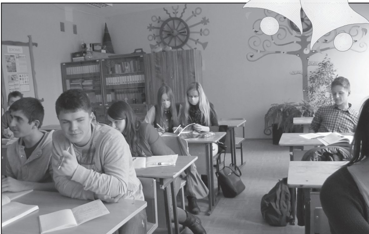
Buvo ir taip... (abiturientai per lietuvių kalbos pamoką)