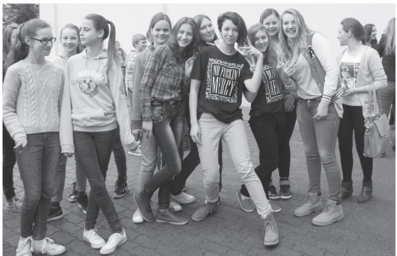
Draugystės šokis "Be patyčių"