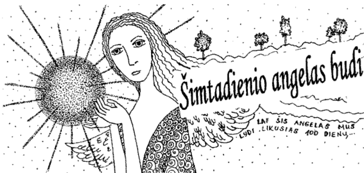
Piešinio autorė Dovilė Kozlovskytė