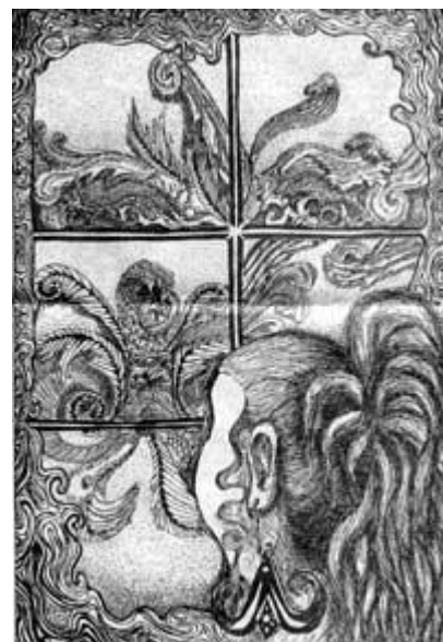
Danutė Vilbrantaitė 2a

Nėra individualybės, nėra subjektyvumo – nėra ir esė