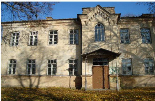
1924 m. Lenkijos okupuotuose Trakuose Lenkijos valdžios įkurta Valstybinės Trakų moterų mokytojų seminarijos pastatas.

XVIIIa. po remonto ant kalvos išaugo barokinis – klasicistinis dviejų aukštų vienuolynas ir dvibokštė su penkiais altoriais bažnyčia, pašventinta 1750m. Istoriniuose šaltiniuose aptinkama, kad šiame vienuolyne buvusi mokykla. Bernardinų vienuoliai buvo sukaukę labai didelę biblioteką. Yra išlikęs jos knygų sąrašas. Didelę sąrašo dalį sudaro knygos, skirtos Lietuvos istorijai, filosofijai, poezijai. Uždarius vienuolyną, biblioteka buvo išblaškyta. Vienuolynui priklausė teritorija, kurią dabar apjuosia Birutės, Vytauto ir Mindaugo gatvės.