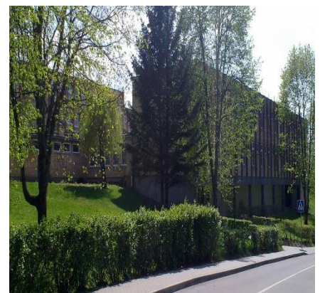
Trakų vidurinė mokykla