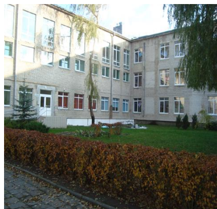
Trakų pradinė mokykla