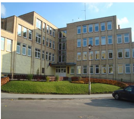
Trakų Vytauto Didžiojo gimnazija