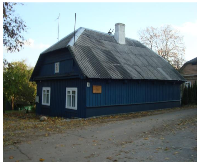
1818 m. klebonaujant Antanui Giedraičiui pastatyta parapijinė mokykla (Birutės g. Nr. 6). Pastatas beveik nepakitęs iki mūsų dienų