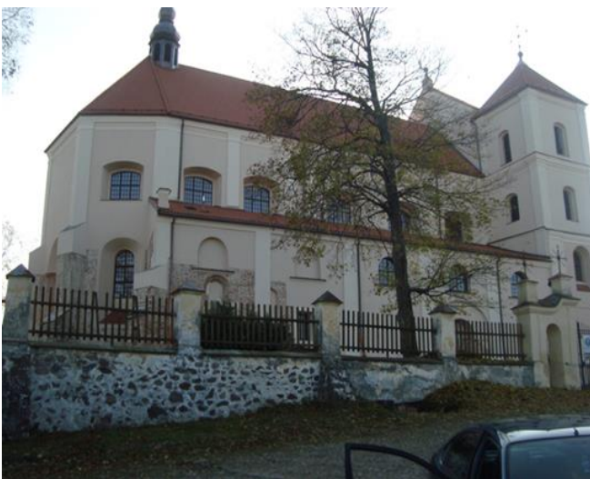
Trakų Švč. Mergelės Marijos Apsilankymo bažnyčia