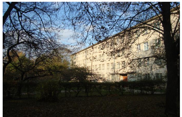
1957m. Mokytojų seminariją perkėlus į Naująją Vilnią, jos vietoje įkurta mokykla – internatas. Mokykla – internatas persikėlė iš Kudirkos gatvės į naują pastatą Birutės gatvėje