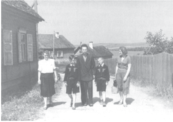
Svečiuojantis Trakuose, prie gimtojo namelio, 1955 m. birželio 26 d.

Algirdas su broliais komjaunuoliais. Jis pats rašė: „...mano disidentavimas ir prasidėjo nuo tų laikų – buvau kitoks ir supratau, kad turiu atsilaikyti“ 7 .